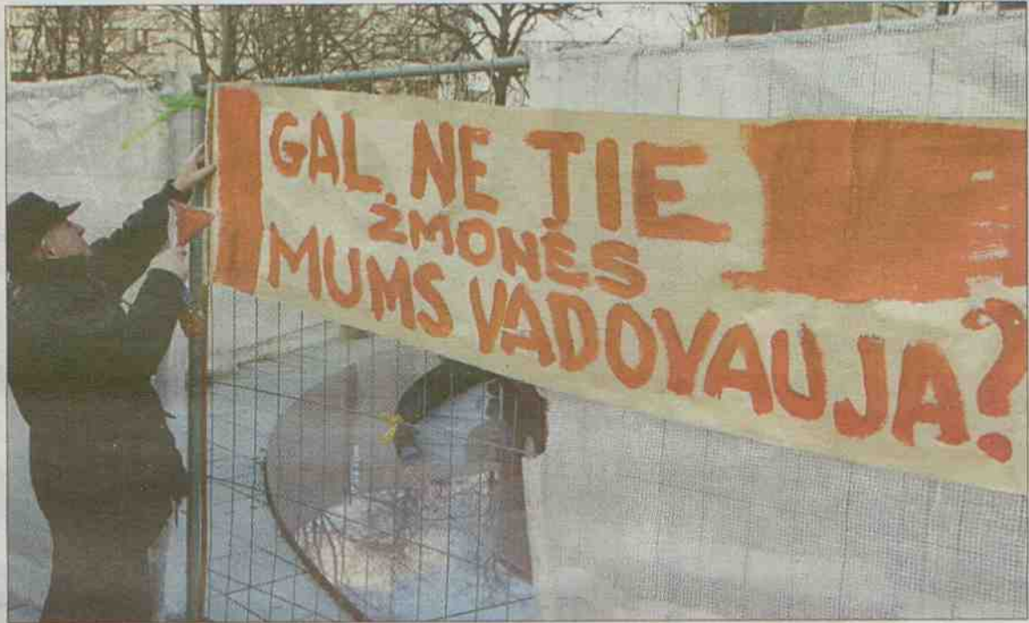
► CUNAMIS. Dėstytojai įspėjo valdžią ruoštis antrai streikų bangai

Aukštųjų mokyklų pedagogai, sulaukę tik formalių atsakymų į pagrįstus skundus, vakar Klaipėdos universitete surengė pirmąją protesto akciją. Dėstytojai buvo atviri: jie nesitiki sulaukti kokios nors reakcijos į savo protestus ir mato vienintelę išeitį - streiką.